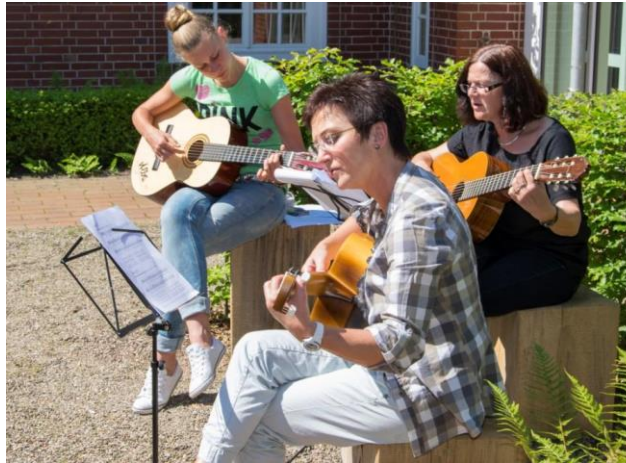
Gitarrenanfängerinnen in den Stapelfelder Gärten

Es sind keine Vorerfahrungen auf der Gitarre und keine Notenkenntnisse erforderlich!